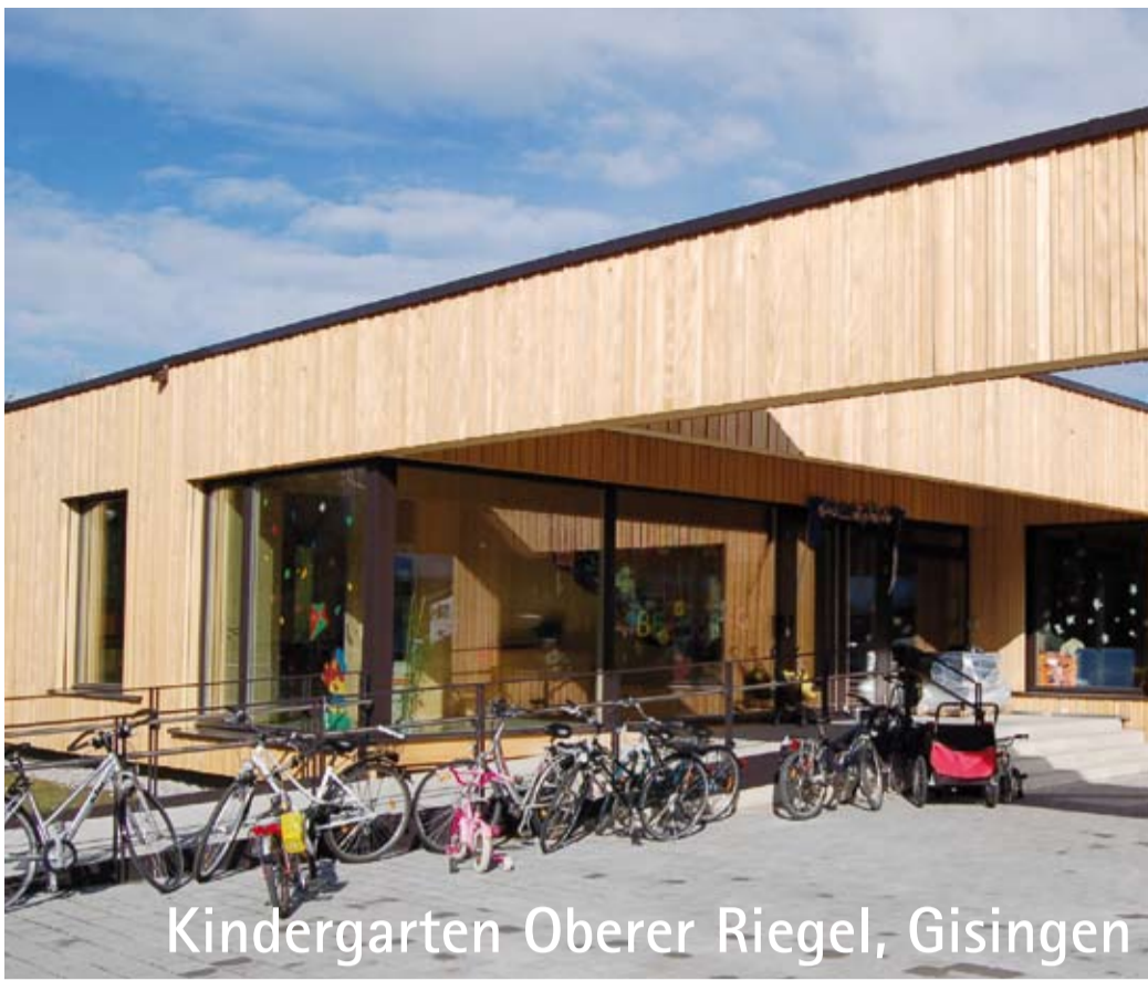
Kindergarten Oberer Riegel, Gisingen