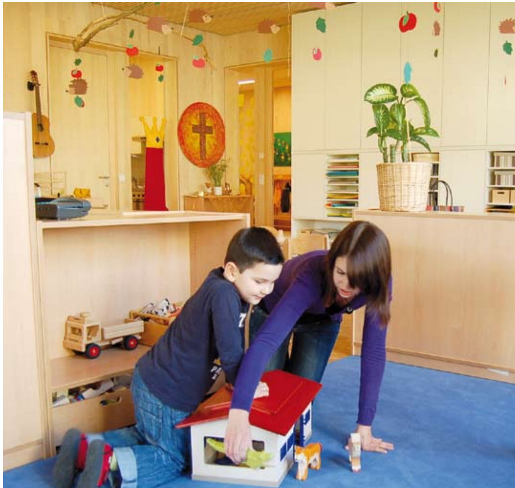
Insgesamt kümmern sich 15 Kindergartenpädagoginnen und 7 Kindergartenhelferinnen um 191 Kinder in den drei Kindergärten.

Die Erweiterungsbauten der Kindergärten Altenstadt/Im Grisseler und Tosters/Alvier können am 20.11. ebenfalls von 10 Uhr bis 14 Uhr besichtigt werden. Dazu ist ein Bus-Shuttledienst eingerichtet.