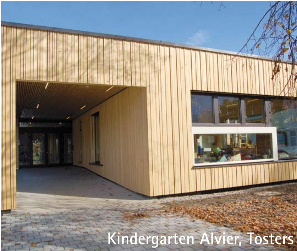
Kindergarten Alvier, Tosters