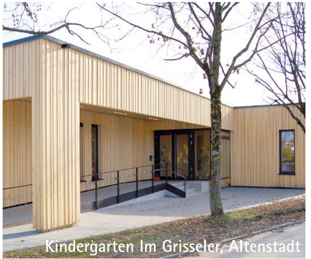
Kindergarten Im Grisseler, Altstadt